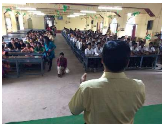
On 15.08.2019 Independence Day was celebrated by the NCC & NSS volunteers along with the TS & NTS of this College