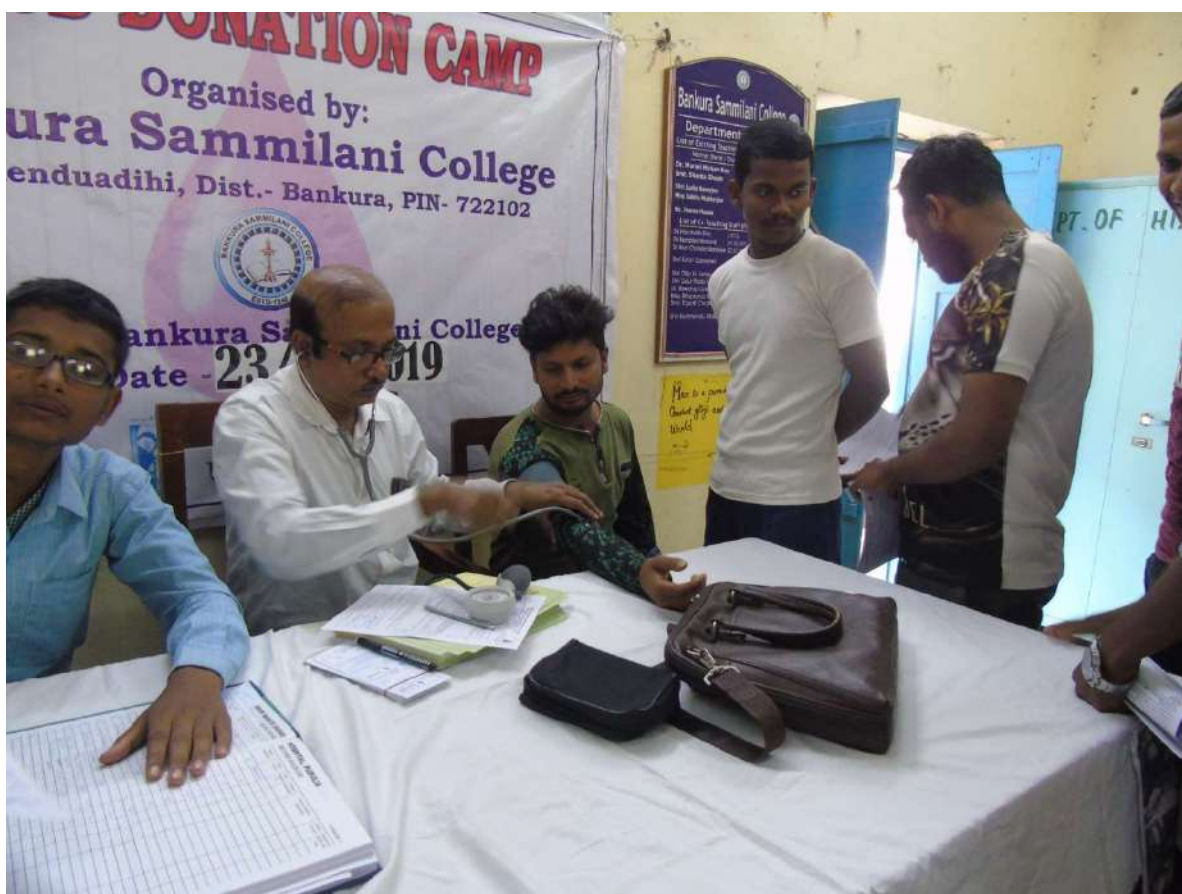
On 23.11.19 Blood Donation Camp was organized by the NCC, NSS & IQAC of our College. 101 Unit of Blood was collected on that day and donated to Blood Bank of Deben Mahato Hospital, Purulia.