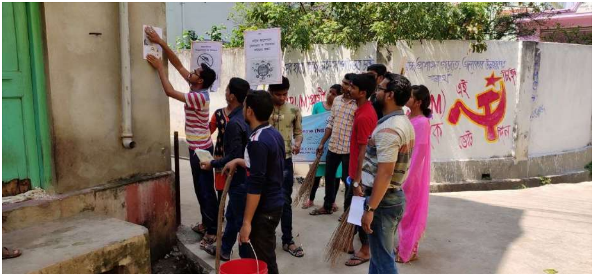
On 13.03.2020 Awareness of Dengue & preventive measures