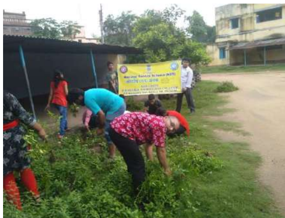
04.08.19 Swachhata & Dengue eradication programme