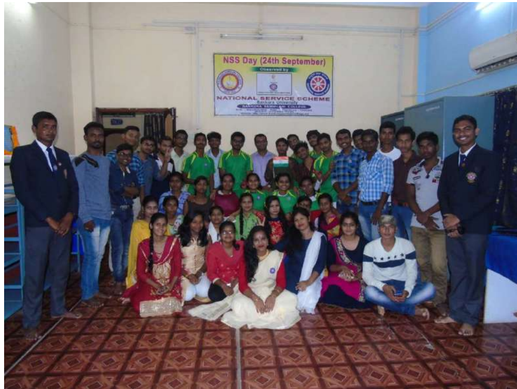
On 24.09.2019 50 th NSS Day was celebrated