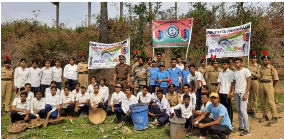
Swachhata Pakhwada programme by NCC cadets of this College