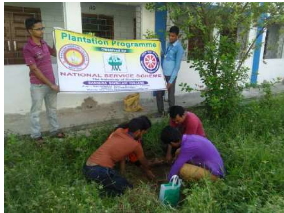
Plantation Programme at Ma Sarada Hostel of our College on 21.07.2019