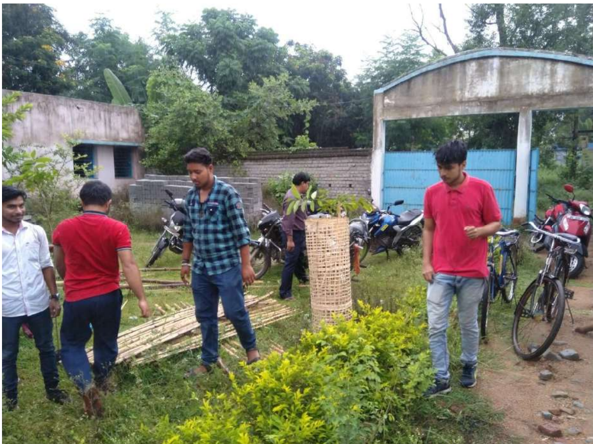
Plantation Programme at Sanghati Chatrabas on 28.07.2019